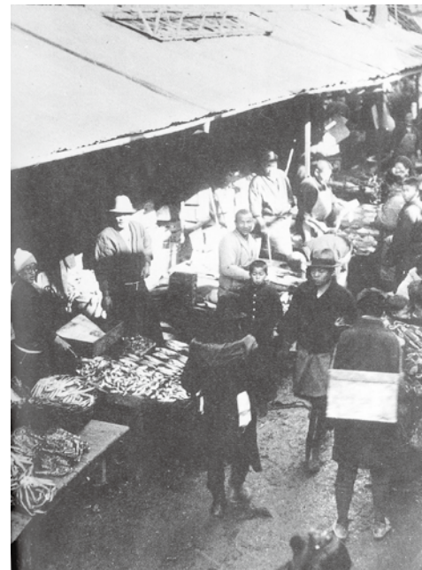
昭和3年の近江町市場 (『まるごと・ザ・金沢近江町』能登印刷より)