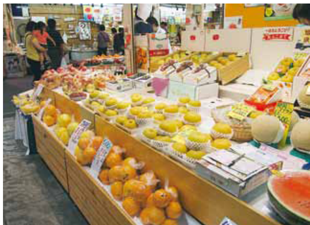
梨、りんごなどが並び、秋の訪れを告げる青果店の店先