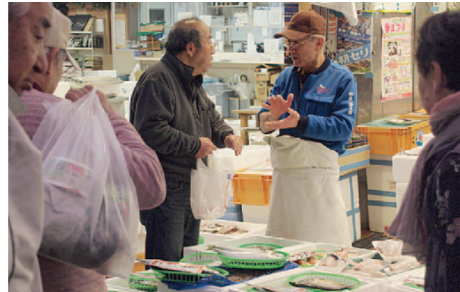
お店の人とのやりとりも、近江町市場の楽しみのひとつ

近江町市場の発祥がいつであったかは、はっきりしない。戦国時代には、この地は耕地と原野が連なる僻地であった。一五四六年に一向宗が「尾山御坊」(金沢御坊、御山とも)を建立し、三十余年、加賀一帯を支配したが、このころ既に「近江町」という地名が記録されていた。尾山御坊を中心に熱心な真宗の参詣人の行き来が盛んで、坊さんや僧兵などの往来も頻繁にあり、門前では彼らを相手に、時代劇の宿場街のような屋台や小屋掛けの物売りが立ち並んで商売をしていたのは確かだという。 一五八〇年に佐久間盛政が尾山御坊を陥落させ、新たに「尾山城」(金沢城とも)