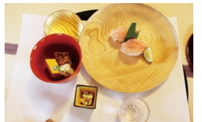
ミシュラン二つ星の日本料理つづらにて、神泉と料理を満喫

選ばれた自信の表情がうかがえました。これまでの過去7回の酒蔵巡りではなかった神泉専用500円商品券が出ました。この商品券を使い切るため、バス出発が遅れました。最後はお目当ての、つづづらゝです。東酒造で買いためた大吟醸神泉一升瓶と純米吟醸ブルーラベル神泉1本の計2本を持ち込み、おいしいお酒とおいしい料理を堪能しました。酒の席で医師協会機関紙・文化部長さま、ゆつくりとした時間を過ごした。バスは帰路に着きました。予定の50分遅れで無事金沢駅西口に到着・解散いたしました。石川県保険医協会機関紙・文化部長さま、の自己紹介を兼ね、自分の趣味の話やワイワイ語り合いました。その中で次はワイナリーも良いわねとの女性からの希望も出ました。