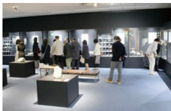
小松市立博物館では宝飾店のように展示された鉱物を見学

第1目的地・小松市立博物館到着。博物館は芦城公園内にあり、桜は散りはじめの地・小松市立博物館3階・日本遺産小松の石文化展示場は宝飾店まがいに見えます。学芸員さんによる展示物の中には金や銅の鉱物のほか、小松で採れる緑色の石「碧玉(へきぎよ)