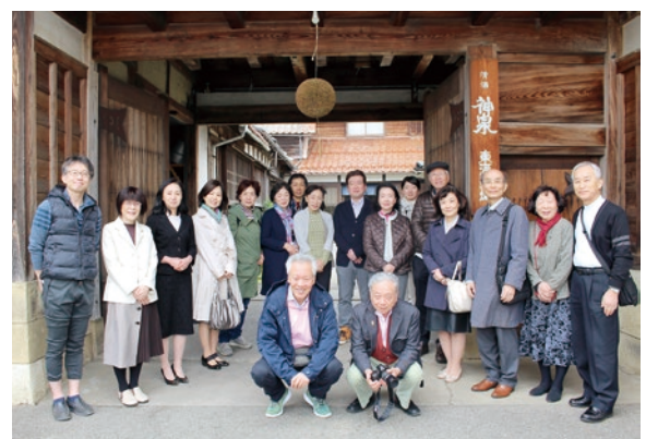
杉玉のかかった東酒造株式会社の前で記念撮影

選ばれた自信の表情がうかがえました。これまでの過去7回の酒蔵巡りではなかった神泉専用500円商品券が出ました。この商品券を使い切るため、バス出発が遅れました。最後はお目当ての、つづづらゝです。東酒造で買いためた大吟醸神泉一升瓶と純米吟醸ブルーラベル神泉1本の計2本を持ち込み、おいしいお酒とおいしい料理を堪能しました。酒の席で医師協会機関紙・文化部長さま、ゆつくりとした時間を過ごした。バスは帰路に着きました。予定の50分遅れで無事金沢駅西口に到着・解散いたしました。石川県保険医協会機関紙・文化部長さま、の自己紹介を兼ね、自分の趣味の話やワイワイ語り合いました。その中で次はワイナリーも良いわねとの女性からの希望も出ました。