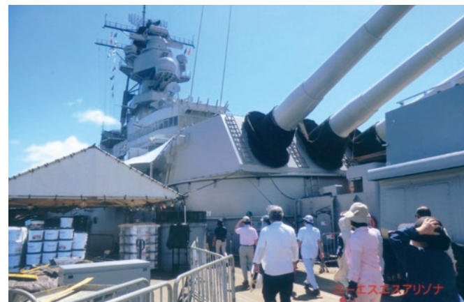
戦艦ミズーリの甲板上を歩く。この奥の右舷側甲板上で降伏文書の署名式が行われた

6月17日、飛鳥IIはカリフォルニア州のサンディエゴに寄港しました。サンディエゴは漁業が盛んな町ですが、海軍の軍事拠点でもあります。ジャカランダの花が咲く通路を經由して、空母ミッドウェーが展示されている博物館を訪ねました。真珠湾攻撃後、日本海軍の暗号解読に成功していたので、ミッドウェー海戦では有利な状況で日本帝国海軍を撃破したと揭示してありました。空母の中も見学でき、作戦指令室、操舵室、乗組員の居住区なども見学しました。格納庫以外は非常に狭く、一般の乗組員が寝るのは3段ベッドで、トイレも狭く、体格の立派な兵士がどうやっ