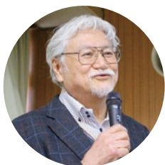
金沢大学名誉教授