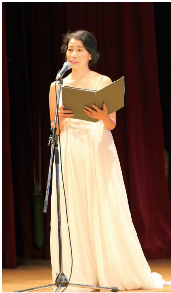
ピアノ演奏、独唱のほか詩の朗読も