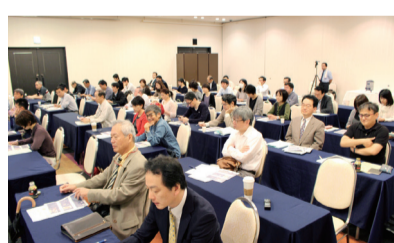
51人が参加し開催された (9月30日・ホテル金沢)

的根拠がなくてはならないということを繰り返し強調しておられました。今回は特に重要な内容をとても分かりやすく説明していただきました。質疑応答も大変活発なものとなり、講演会終了後も講師の周りに質問者が列をなしている状況でした。今後この会を続けていく予定ですので、多くの方にご参加いただきたくと考えています。