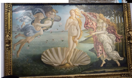
メディチ家の至宝、ウフィツィ美術館の入り口。世界中の観光客が集まる。そして、名画の一つ「ヴィーナス誕生」

ようがない。おいしいけれ ど密度が濃いのだ。最近日 本料理に目覚めたコは食 傷気味。胃もたれして、た くさん食べられない。もう 一つの定番が肉料理。生 ハムやローストビーフが必 ず付く。なぜか、生野菜が 少ない。どうして？ ランチが終わってから、 ラッッシュさえ焚かなければ 自由に撮れる。日本とは大 違い。芸術と観客の敷居が 格段に低い。これだけでも 驚きだ。通なら、何日でも 通うウフィツィ美術館を超 高速で回っていく。本館に 向かう途中の都台でまたの機 会に！「またの機会って、 あるんかい？ 雰囲気だけ 味わっている私ははっとし ているが、うちの嫁さんは とても残念そう。